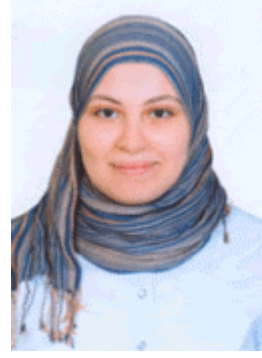
هبة الله محمد حسين منحة 70% من قيمة المصروفات الدراسية