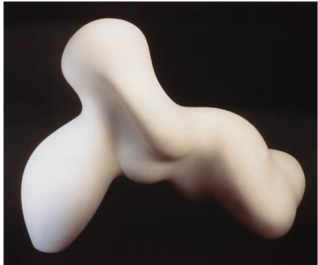
صورة رقم (٣)