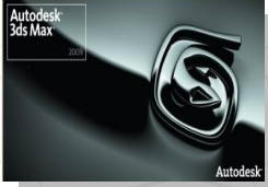
Image Editing & Animation Track Graphic & Multimedia