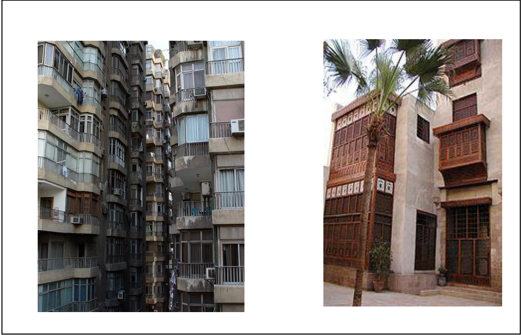
شكل 41: المشربية في بيت السحيمي، وتقارب واجهات المباني بشكل يفقدها الخصوصية البصرية (مبنى سكني بالزمالك)

والتي تمكن من بداخل المسكن من رؤية من الخارج والتمتع بالمنظر ولا تسمح بالعكس وذلك رغم تقارب المسكن في النسيج المتضام، شكل (41).