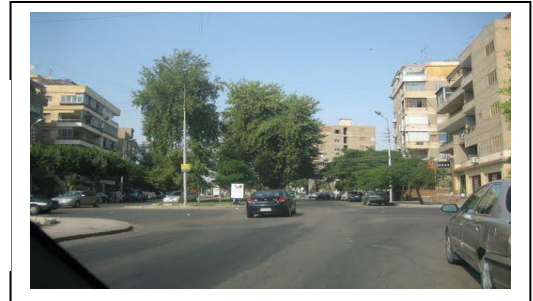
شكل 40 : تحقيق الخصوصية البصرية من خلال الأشجار الفاصلة بين واجهات المساكن والمسافات البينية الملائمة

لابد للمسكن أن يحقق اتصالاً بصرياً ذا مستوى معقول بالخارج لتوفير الاتصال بين البيئة الداخلية بالمسكن والبيئة الخارجية بشكل لا يؤثر على خصوصية المسكن وتتحقق الخصوصية البصرية على مستوى البيئة المحيطة عن طريق عناصر البيئة الطبيعية والتي هي من صنع الله كالأشجار والجبال والتضاريس المختلفة التي تلعب دوراً أساسياً في التشكيل الخارجي حول المسكن وحجب أنظار المتطفلين كما في شكل رقم (40)، بالإضافة إلى حفظ المسافات البينية بين البلوكات السكنية.