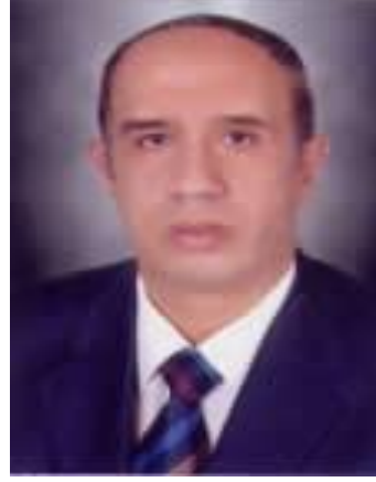
السيد الأستاذ الدكتور/ أحمد عبده جعيس رئيس الجامعة