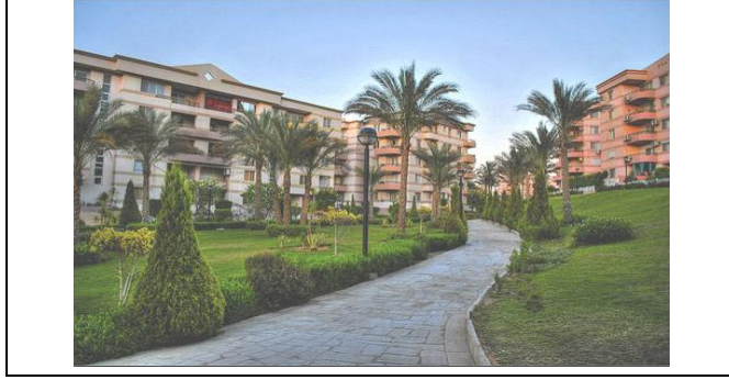
شكل 43: المساحات الخضراء وعناصر اللاندسكيب وإضفاء البهجة على مستوى البيئة الخارجية (مدينة الرحاب بالقاهرة)

والمسطحات المائية كالنافورات بالإضافة إلى عناصر اللاندسكيب كأعمدة الإنارة والمقاعد حيث أن لألوانها وطريقة تشكيلها الأثر في إضفاء البهجة على البيئة المحيطة بالمسكن. شكل (43).