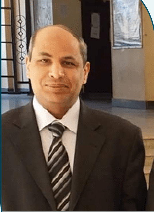
أ. د. حسن محمد حويل عميد كلية التربية