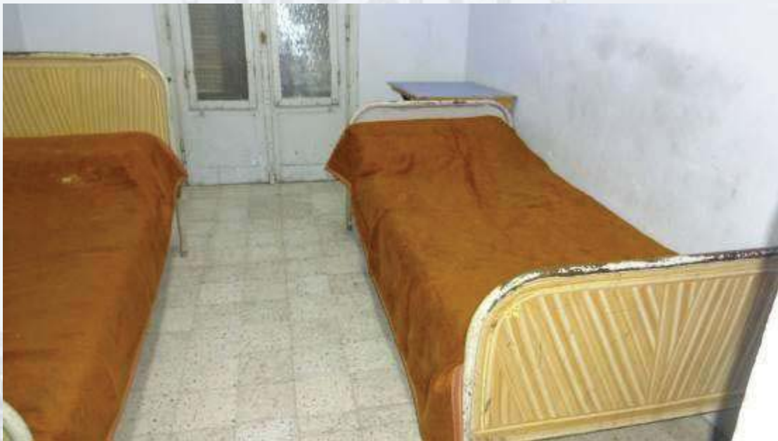
غرفة داخل مبنى (ز)