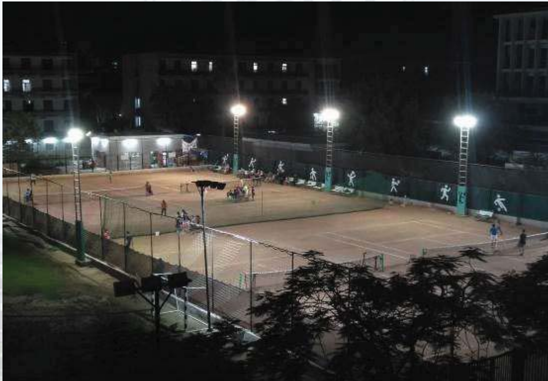
ملاعب متنوعة لممارسة الأنشطة الرياضية