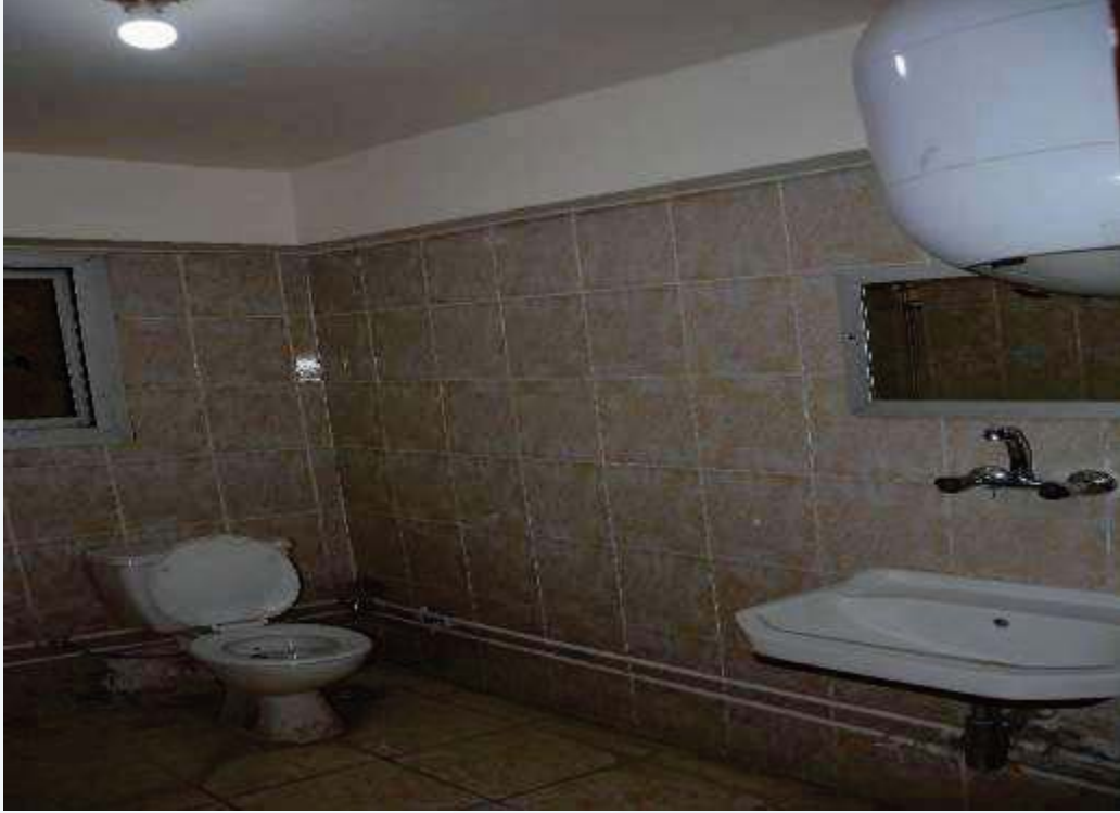
دورة مياه داخل قطاع (٢) للوفود

تتمتع المدن الجامعية بمستوى صحي من دورات المياه؛ حيث تحتوي على دورات مياه عادية و متميزة بالوحدات السكنية المختلفة، وفيما يلي عرض لصور لبعض دورات المياه في المدن الجامعية: