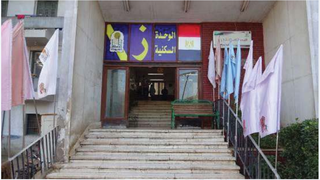
غرفة من داخل مبنى (الإسكان الفاخر)