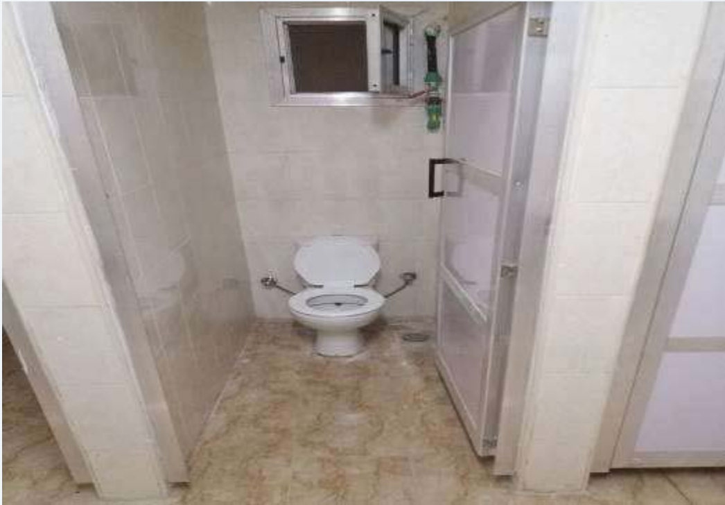
الحمام بمبنى (الإسكان الفاخر)