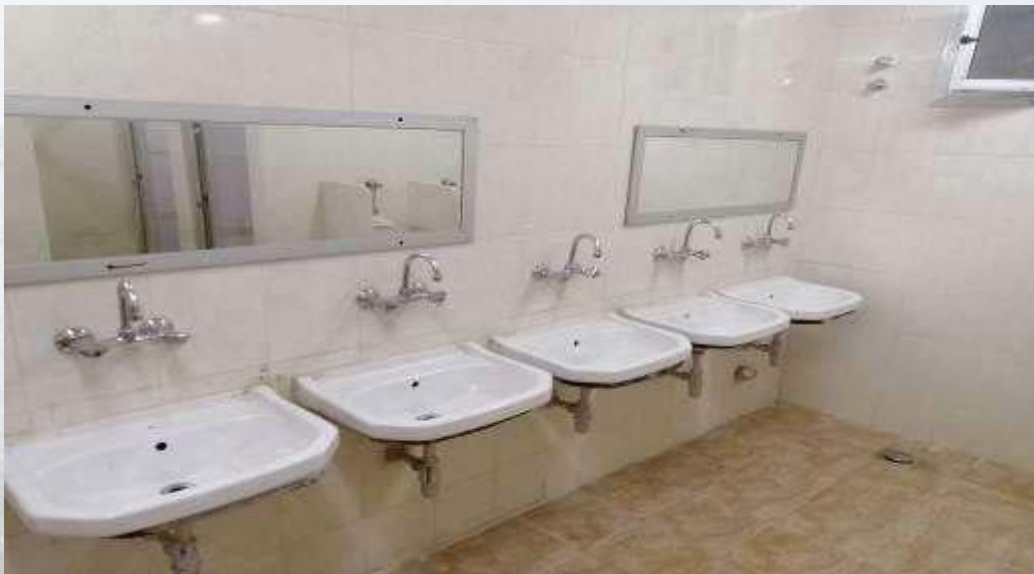
أحواض مياه داخل مبنى (د)