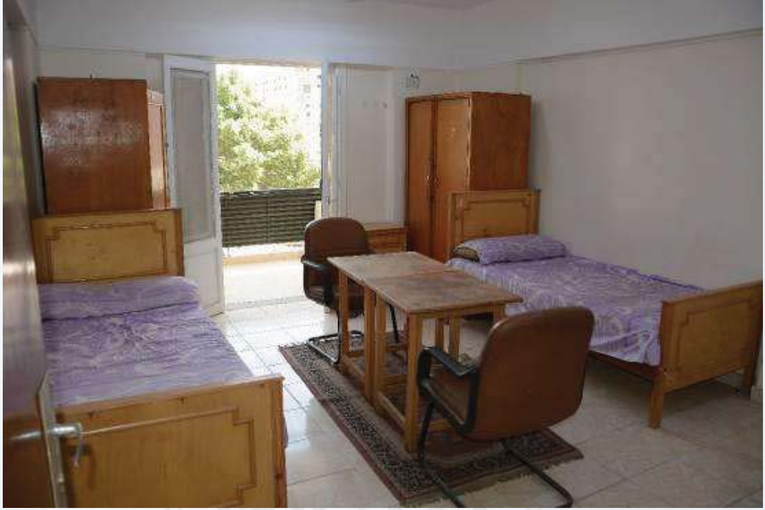
مبنى (الإسكان الفاخر)