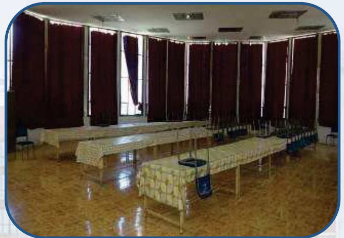
صور من مطعم المدينة طالبات